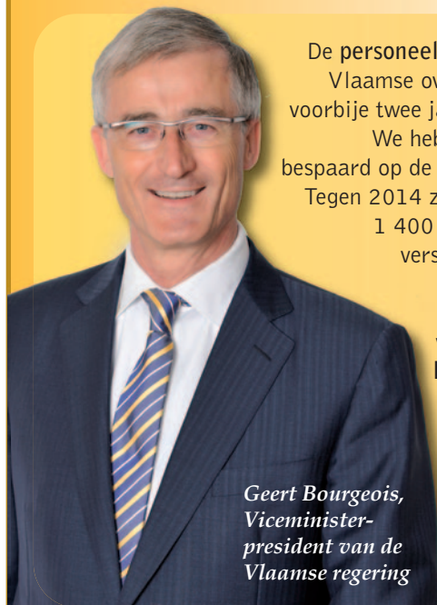
Geert Bourgeois, Viceminister- president van de Vlaamse regering

De personeelsbudgetten van de Vlaamse overheid daalden de voorbije twee jaar met 5 procent. We hebben ook drastisch bespaard op de werkingsmiddelen. Tegen 2014 zullen er bovendien 1 400 ambtenaren op de verschillende Vlaamse departementen niet stelselmatig vervangen worden. Een besparing van 50 miljoen euro per jaar!