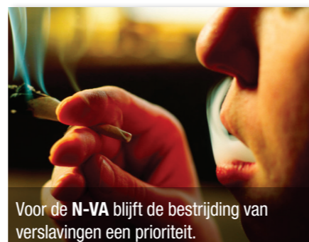
Voor de N-VA blijft de bestrijding van verslavingen een prioriteit.

We mogen dit probleem niet onderschatten. Er zijn verschillende soorten verslavingen en vaak zijn die 'verdoken'. Daarom steunt de N-VA alle initiatieven die mensen ertoe aanzetten om over hun verslaving te praten zodat zij deze kunnen overwinnen.