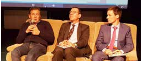
Debat over drugsbeleid p.2