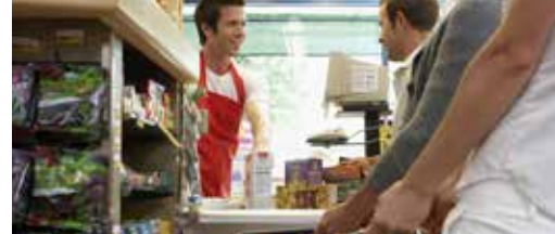
Aangepaste winkeltaks p.3