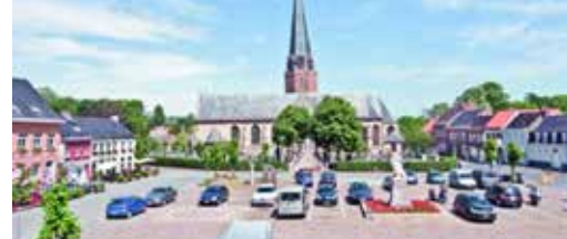
Kunstenfestival Watou behouden p. 3