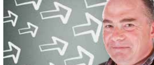
Onze speerpunten in 2018 p. 3