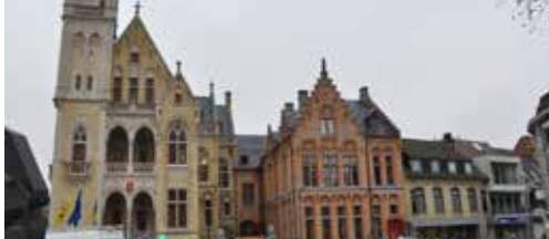
Live vanop de gemeenteraad p. 2